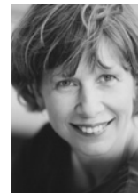
< tiile barkhoff